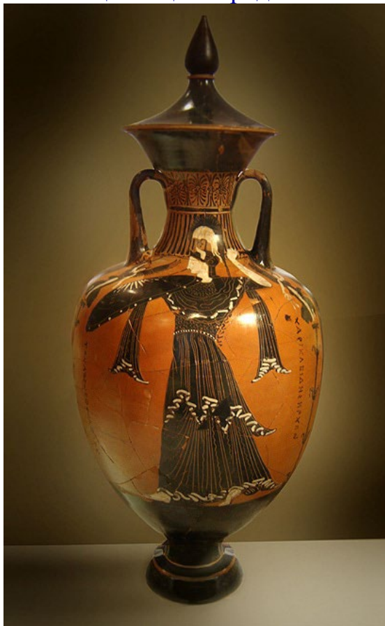
Афина на панафинейской амфоре.

Афиняне, от самых высокопоставленных граждан до скромных земледельцев, понимали огромную ценность оливкового дерева. Оно занимало центральное место в их мифологии. В знаменитом споре о покровительстве городу между богиней Афиной и Посейдоном Афина подарила городу оливковое дерево, символизирующее пропитание, мир и процветание, чем завоевала расположение народа и стала божественной защитницей города.